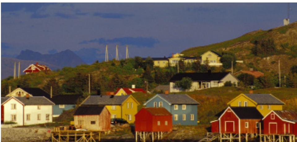
VEKSTSENTER: Lurøy kommune har investert 30 millioner kroner i bedre oppvekstvilkår i vekstsenteret Lovund.

På Lovund er det foredling av oppdrettsfisk som gir nye arbeidsplasser. Fisk fra oppdrettsanlegg i forskjellige områder i Nordland skipes til Lovund, hvor den slaktes